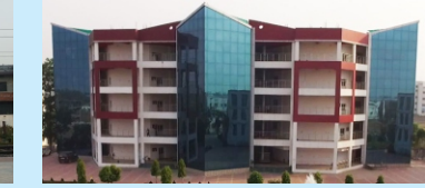
NSIT (10 Min.)