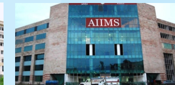
AIIMS (30 Min.)