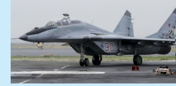
Bihta Airforce Base (5 Min.)