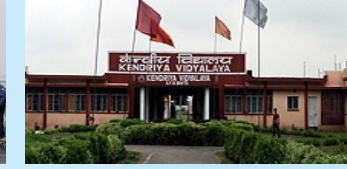
Kendriya Vidyalaya Bihta(5 Min.)