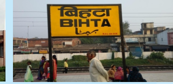
Bihta Rly. Station (5 Min.)