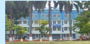
NIT Patna (1 Min.)