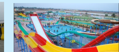
Water Park (10 Min.)

बिहटा (पटना) में N.H.30. हाईवे के पास आवासीय योजनाओं में प्लॉट Plot Size : 900 Sq.ft., 1200 Sq.Ft. , 1800 Sq.Ft, 2400 Sq.Ft...etc.