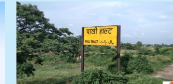
Pali Halt (2 Min.)