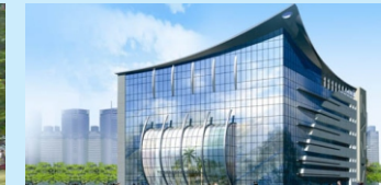
IT Park (1 Min.)