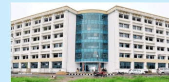
IIT Patna (10 Min.)