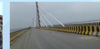
Chhapra Overbrige (30 Min.)