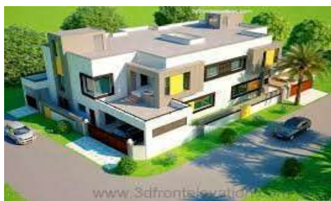
Corner Plot PLC - Rs. 1000