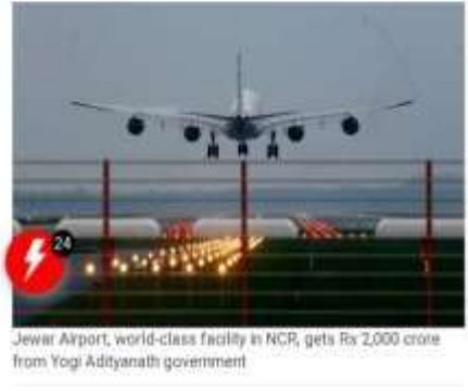
Jewar Airport, world-class facility in NCR, gets Rs 2,000 crore from Yogi Adityanath government