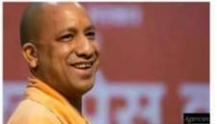
The UP government on Tuesday presented a Rs 5,12,860.72 crore budget for FY 2020-21 in the state assembly.

The Uttar Pradesh government on Tuesday allotted a fund of Rs 2,000 crore for the Jewar Airport in Gautam Buddha Nagar.