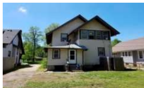
Park Facing PLC - Rs. 1000